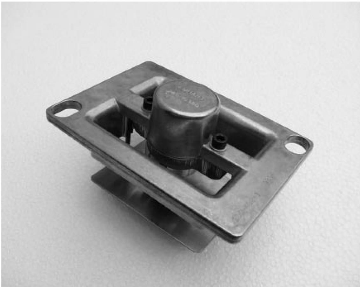
Auf/Zu-Steuermechanismus für Formenkühlung 200-402-1